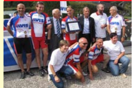
Il presidente nazionale Avis premia i nostri ciclisti.